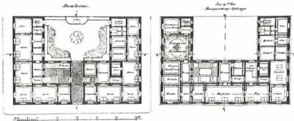
FORSIKRINGSELSKABET DANMARKS BYGNING.

Saalænge Sundhedskommissionen savner fast teknisk Medhjælp, har det været undskyldeligt, om dens Raadgivere — in specie dens Lægepersonale — har kunnet